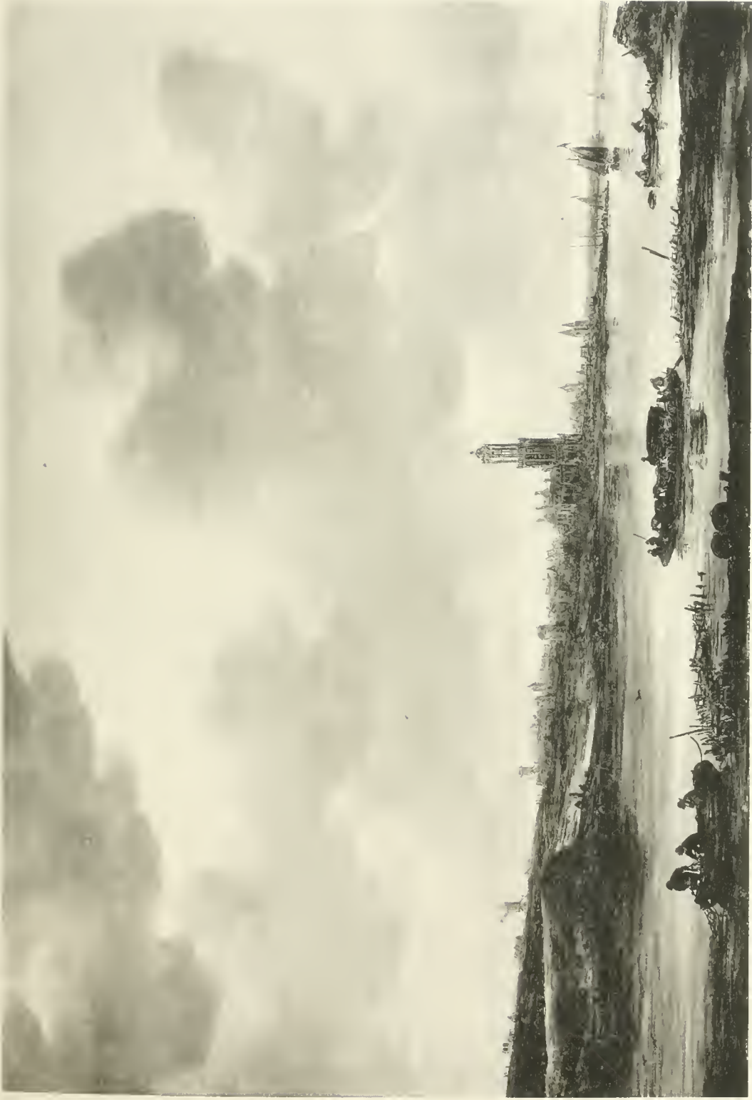
J VAN GOYEN